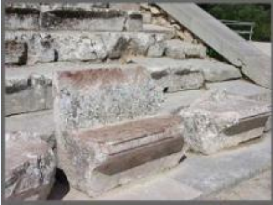
Каменная скамейка для зрителей

В Афинах на спектакле могли присутствовать сразу двадцать семь тысяч зрителей! Так что всё население города могло смотреть спектакли. Места для зрителей делали каменными.